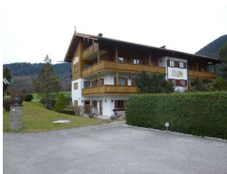
Weg vom Parkplatz zum Eingang