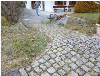
Weg vom Eingang zum Frühstücksraum