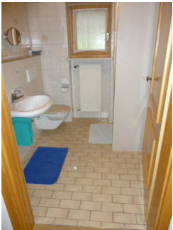
Bad mit Dusche / WC