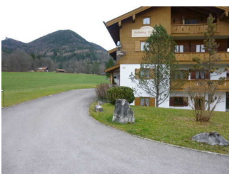
Weg vom Eingang zum Frühstücksraum