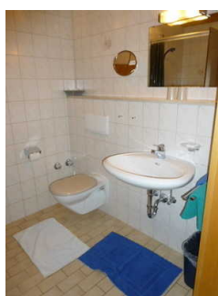
Bad mit Dusche / WC