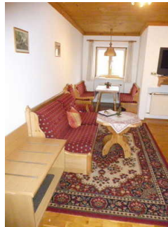
Wohn- Schlafraum Wohnung 2