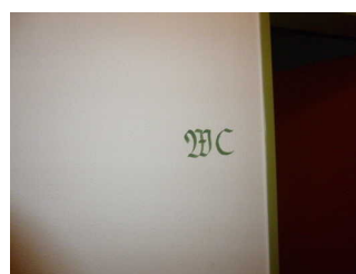
Öffentliches WC im Untergeschoss