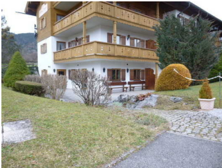
Weg vom Eingang zum Frühstücksraum