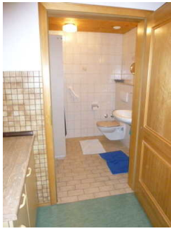
Bad mit Dusche / WC