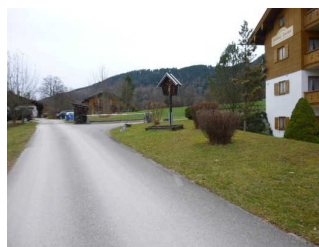
Weg vom Parkplatz zum Eingang