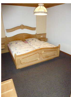
Schlafraum mit Doppelbett