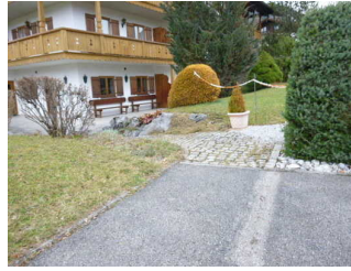
Weg vom Eingang zum Frühstücksraum