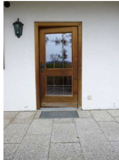
Weg vom Eingang zum Frühstücksraum