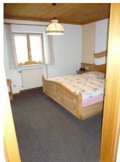
Schlafraum mit Doppelbett