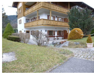
Ansicht Frühstücksraum von außen