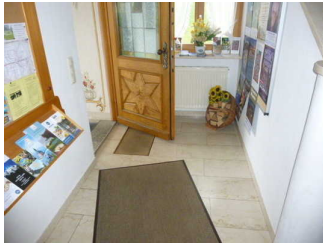
Weg vom Eingang zu den Wohnungen