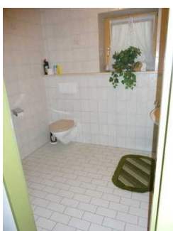
Öffentliches WC im Untergeschoss