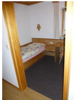
Schlafraum mit 2 getrennten Betten