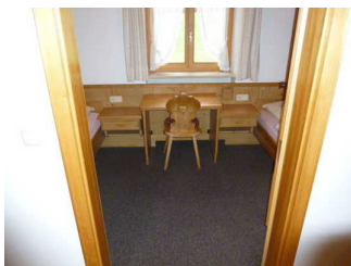
Schlafraum mit 2 getrennten Betten