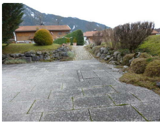
Weg zum Frühstücksraum