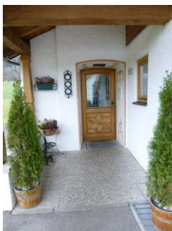
Weg vom Eingang zu den Wohnungen