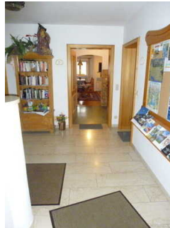
Weg vom Eingang zu den Wohnungen