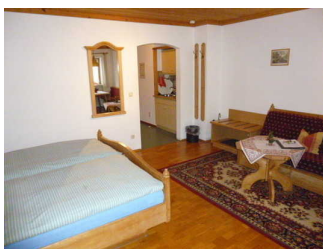
Wohn- Schlafraum Wohnung 2