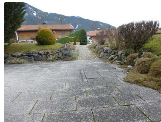
Weg vom Eingang zum Frühstücksraum