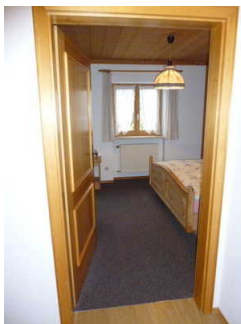
Schlafraum mit Doppelbett