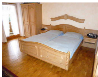
Wohn- Schlafraum Wohnung 2