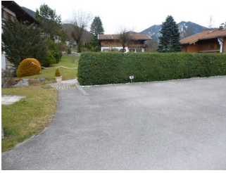
Weg vom Eingang zum Frühstücksraum