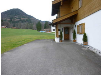
Weg vom Parkplatz zum Eingang