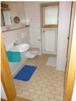
Bad mit Dusche / WC