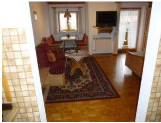
Wohn- Schlafraum Wohnung 2