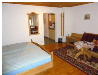
Schlaf- und Wohnbereich