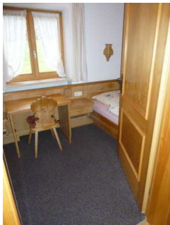
Schlafraum mit 2 getrennten Betten