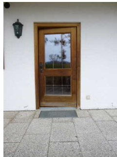
Tür zum Frühstücksraum