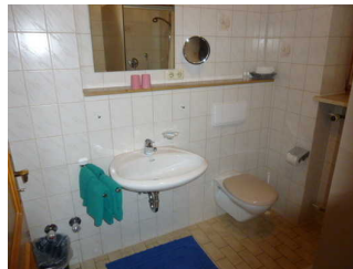
Bad mit Dusche / WC