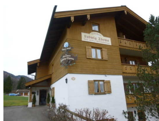
Gästehaus Ludwig Thoma