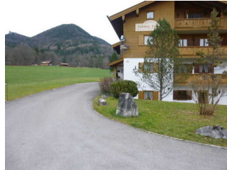
Weg vom Parkplatz zum Eingang