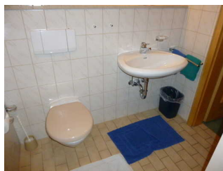
Bad mit Dusche / WC