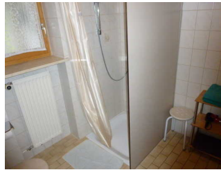
Bad mit Dusche / WC