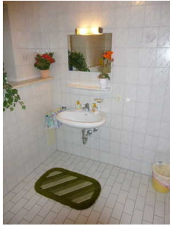
Öffentliches WC im Untergeschoss