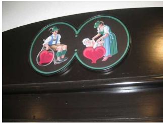
Beschilderung des Behinderten-WC's