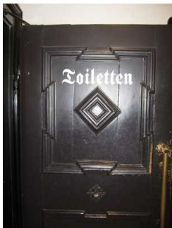
Tür zu den Toiletten.

Die Tür ist keine Karussell- oder Rotationstür.