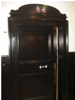
Tür zum WC.