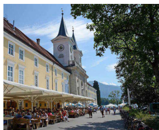
Außenansicht Bräustüberl Tegernsee