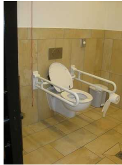
Ansicht vom WC.