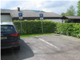
Parkplatz für Menschen mit Behinderung.