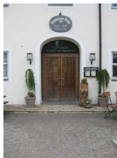
Tür vom Haupteingang.