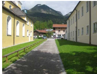
Weg vom Parkplatz zum Eingang.