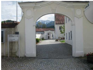
Weg vorm Eingangsbereich.