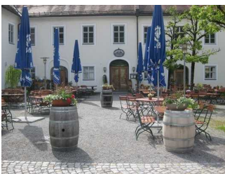
Eingangsbereich und Außengastronomie.