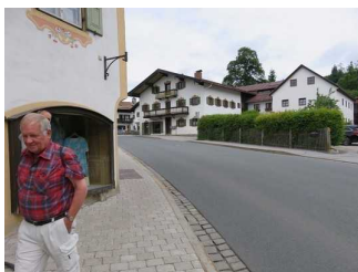
Engstelle am Bürgersteig