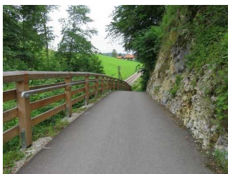
Steigung vom Freudenberg