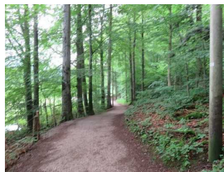
Weg im Wald vor dem Freudenberg