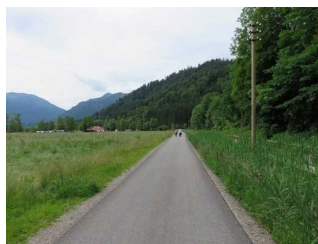
Weg auf der Straße