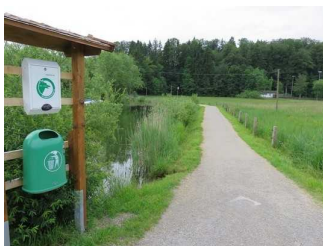
Start des Wanderweges