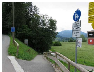
Gefälle zum Freudenberg