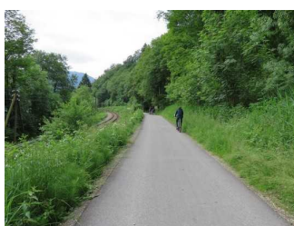
Weg auf der Straße am Westufer