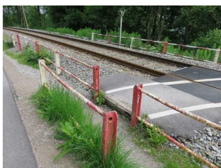
Engstelle vor dem Übergang