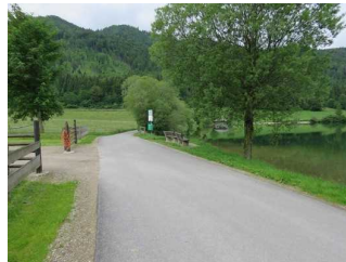
Weg mit Sitzgelegenheiten