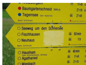
Beschilderung und Wegweiser