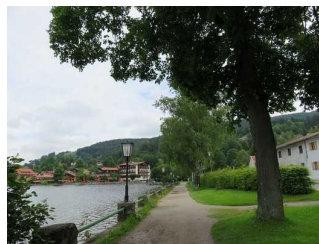
Weg entlang des Sees