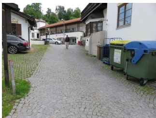
Kurzes Stück mit Pflastersteinen