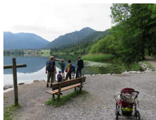
Sitzgelegenheiten am See