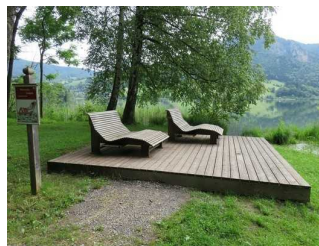
Ruheliegen am Ufer