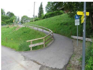
Blick auf das Gefälle