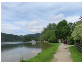
Weg am See