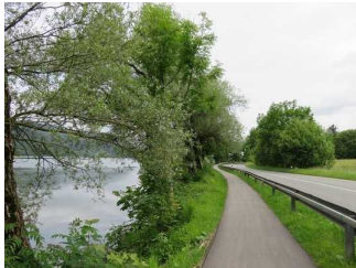
Weg entlang Ostufer