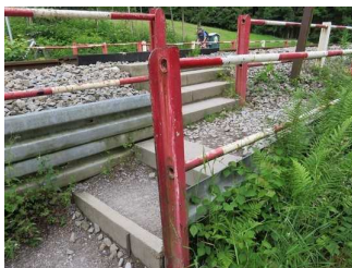
Stufen nach dem Übergang