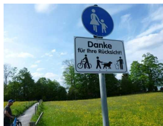
Enger Weg, Fahrradfahrer absteigen