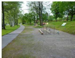
Seepromenade bei Seeglas