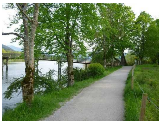
Seepromenade bei Gmund