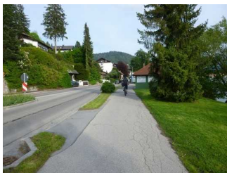
Weg entlang der Straße richtung Tegernsee