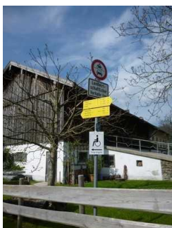
Beschilderung vom Weg