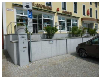
Parkplatz für Menschen mit Behinderung am Rathaus