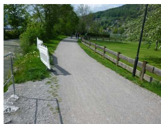
Weg vor Rottach- Egern