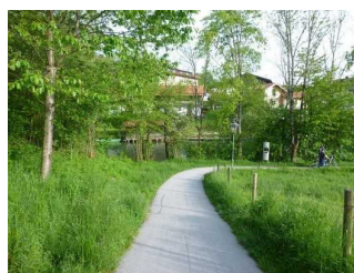
Gefälle nach Gmund