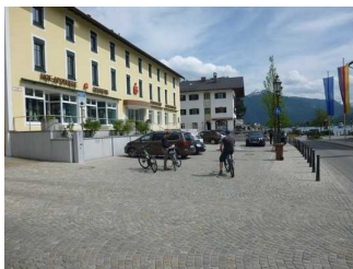
Parkflächen am Rathaus Tegernsee