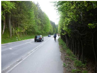
Weg entlang der Straße