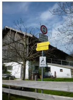
Beschilderung des Rundweges

Es sind Informationen vorhanden, die der Orientierung dienen und aus Wörtern bestehen.