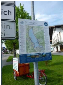
Informationstafeln am Weg