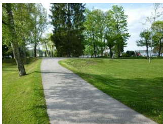
Weg nahe Bad Wiessee