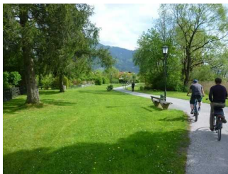
Weg bei Rottach- Egern