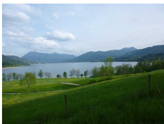
Blick auf den Tegernsee