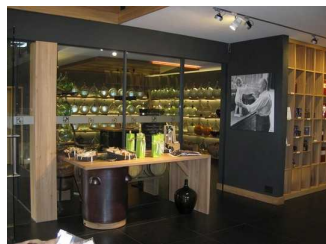
Ausschnitt vom Laden mit Blick auf die Schatzkammer.