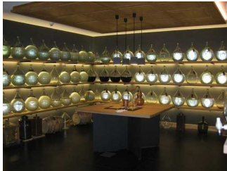
Schatzkammer und die darin stehenden Glasballons für Destillate

Technische Möglichkeiten der Informationsvermittlung: Filme