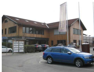
Gebäude der Destillerie.