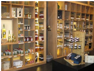
Destillate im Laden