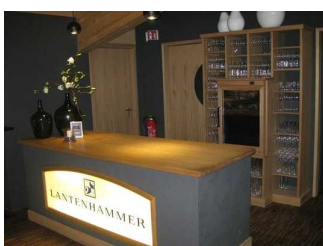
Tresen für Verkostungen.