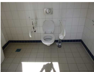
WC am Rathaus Tegernsee