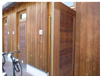
Tür zum WC