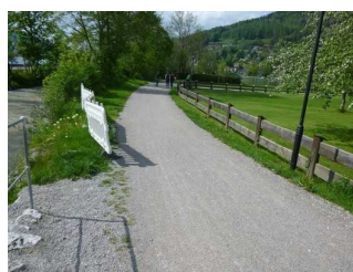
Weg vor Rottach- Egern