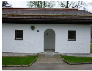
WC Gebäude Abwinkl