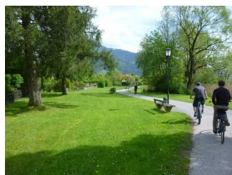
Weg bei Rottach-Egern