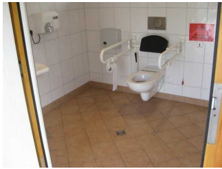
WC in Bad Wiessee