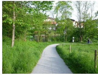
Gefälle nach Gmund