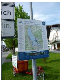
Informationstafeln am Weg