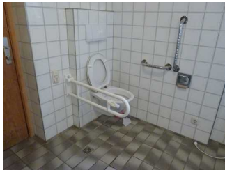
WC an Promenade in Seeglas