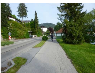
Weg entlang der Straße richtung Tegernsee