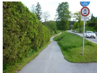
Weg entlang der Straße