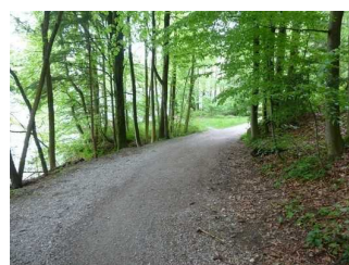
Weg durch ein Waldstück