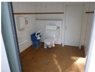
WC am Seeforum in Rottach-Egern