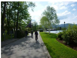
Weg auf der Straße