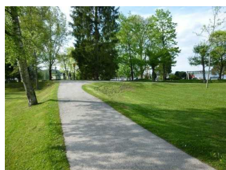
Weg nahe Bad Wiessee