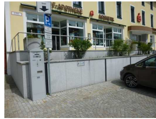
Parkplatz für Menschen mit Behinderung am Rathaus