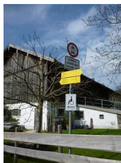
Beschilderung des Rundweges