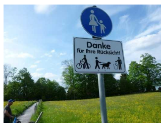
Enger Weg, Fahrradfahrer absteigen