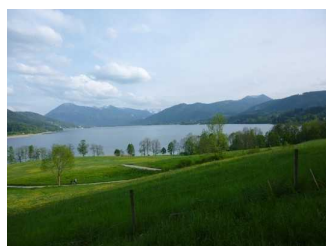
Blick auf den Tegernsee