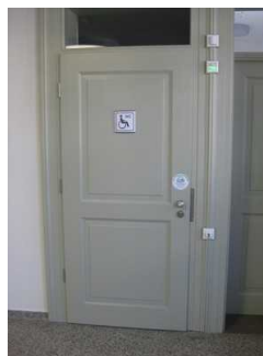
Tür zum WC