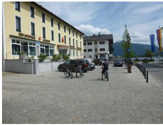
Parkflächen am Rathaus Tegernsee