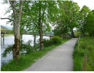
Seepromenade bei Gmund