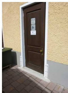
Tür zum WC