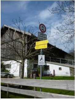
Beschilderung vom Weg