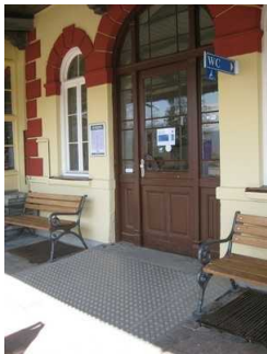
Tür Hintereingang T-Info Gmund

Die Tür ist keine Karussell- oder Rotationstür.