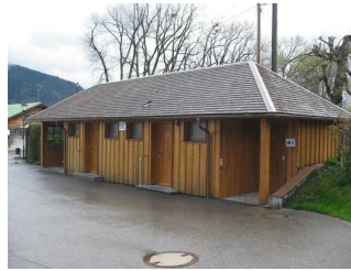
WC Gebäude an der Seepromenade in Bad Wiessee