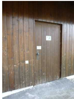
Tür zum WC in Seeglas