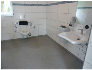
WC in Abwinkl