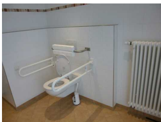
WC in Rottach