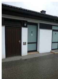
WC Gebäude bei der Kirche in Rottach