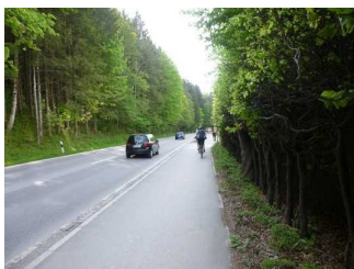
Weg entlang der Straße