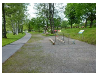
Seepromenade bei Seeglas