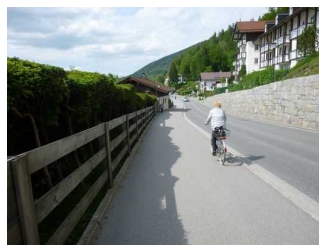
Weg entlang der Straße