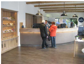
Innenraum der Tourist-Information.