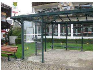
Warteplatz an der Haltestelle Lindenplatz.

Entfernung der Haltestelle für Menschen mit Behinderung zum Eingangsbereich: 10 m.