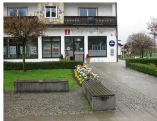
Blick auf die Tourist- Information.