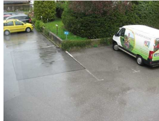
Parkplatz an der Sparkasse.