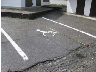
Öffentlicher Behinderten-Parkplatz in der Nähe.