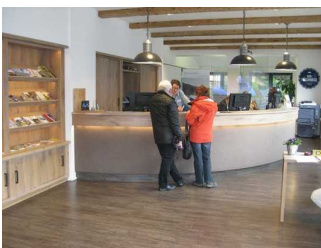
Tresen und Kundenraum.

Der Schalter/Tresen/die Kasse ist von der Eingangstür aus direkt sichtbar.