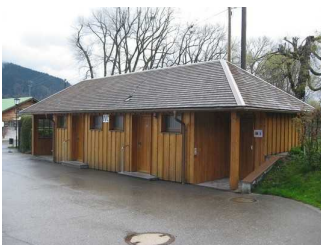
WC Gebäude an der Seepromenade in Bad Wiessee.