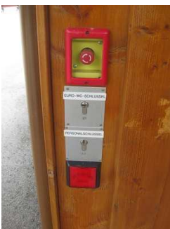
Bedienelemente und Öffner zum WC.

Anmerkungen für den Gast: Spülauslöser im Haltegriff.