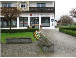
Eingangsbereich der Tourist- Information.