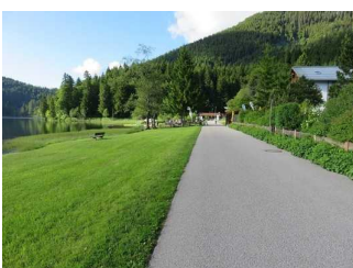
Wegeabschnitt Ostseite vom See - Asphalt