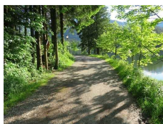
Weg nach dem Parkplatz