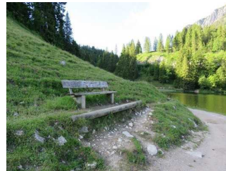
Bank am Westufer