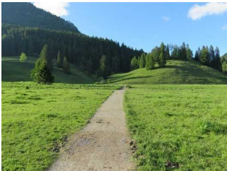
Weg auf der Westseite