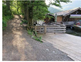
Bootsverleih und Neigungen