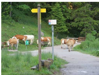
Beschilderungen am Weg

Die Informationen sind in gut lesbarer Schrift vorhanden.