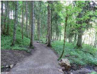
Weg am Westufer