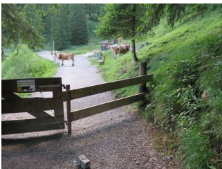
Tor für die Kühe