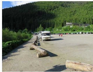
Parkplatz "am See"