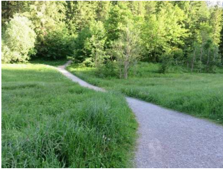
Weg durch den Wald auf der Westseite