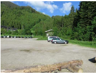
Große Parkfläche am See