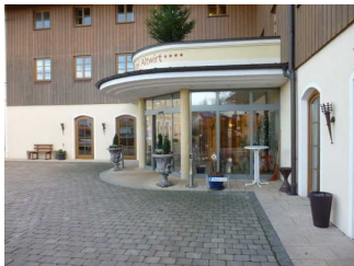
Behinderten PKW Stellplatz