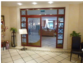
Tür zum Restaurant