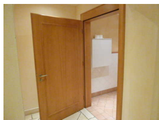
Tür zum WC