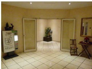
Weg vom Aufzug zum Behinderten- WC