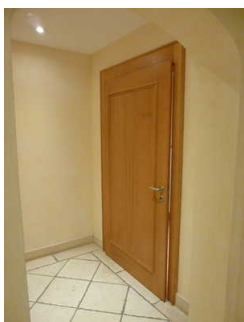
Tür zum WC