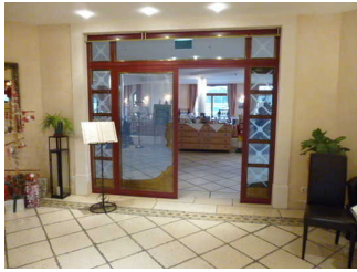
Tür zum Restaurant