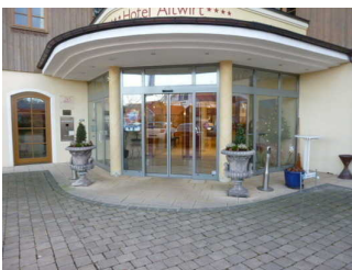
Weg vom Parkplatz zum Eingang