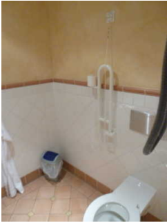
WC für Menschen mit Beeinträchtigungen

Anmerkungen für den Gast: Behinderten-WC als solches nicht ausgeschildert.