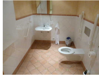
WC für Menschen mit Beeinträchtigungen