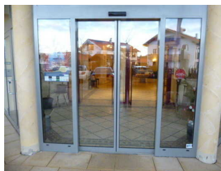
Tür zur Lobby