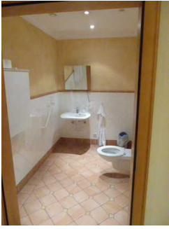
WC für Menschen mit Beeinträchtigungen