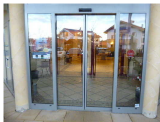
Tür zur Lobby