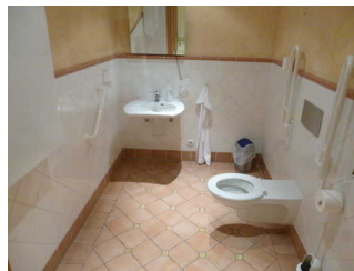
WC für Menschen mit Beeinträchtigungen