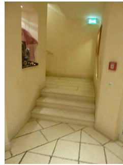
Treppe vom UG zum EG