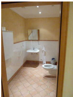
WC für Menschen mit Beeinträchtigungen