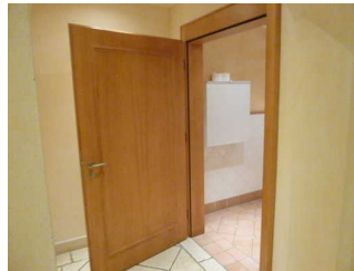
Tür zum WC