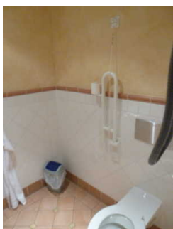
WC für Menschen mit Beeinträchtigungen