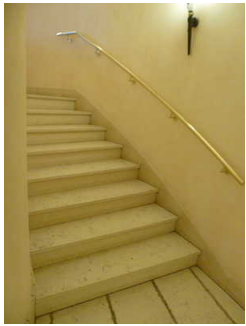
Treppe vom UG zum EG