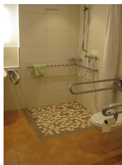
Man sieht die Duschfläche sowie das WC und die angebrachten Haltegriffe.