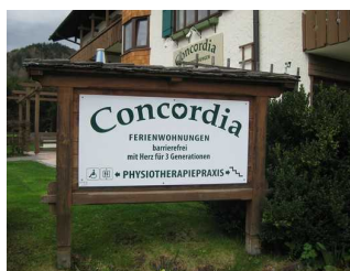
Willkommensschilder Ferienwohnung Concordia.