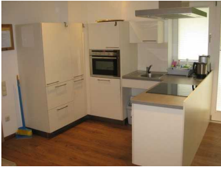
Ausstattung in der Küche.