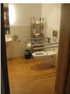
Zu sehen ist die Ausstattung im Öffentlichen WC.