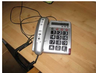
Telefon mit optischem Signal.