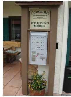
Türöffner und Klingeln.

Der Eingangsbereich ist visuell kontrastreich zur Umgebung abgesetzt.