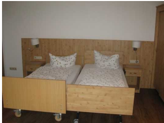
Betten im Appartement 2.