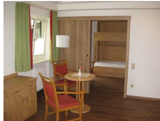
Ausstattung im Appartement 2. Zu sehen ist im Hintergrund das Hochbett.