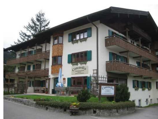
Außenansicht der Ferienwohnungen Concordia.