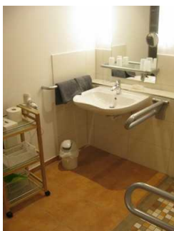
Zu sehen ist das Waschbecken im Sanitärraum.