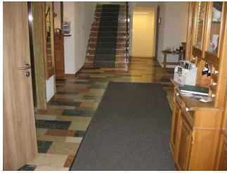
Flurabschnitt zum Frühstücksraum.