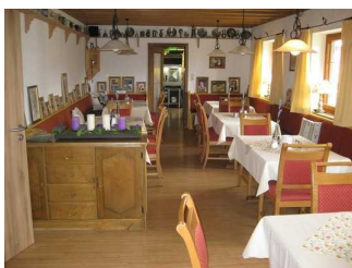
Tische und Stühle im Andreasstüberl.