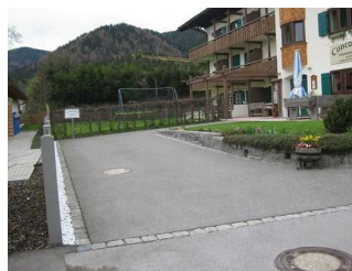
Fläche des Behinderten-PKW-Stellplatzes vor dem Eingang.