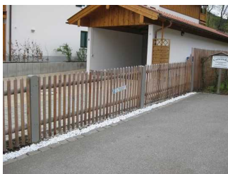
Beschilderung des Parkplatzes.