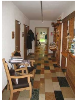
Flurbereich zu den Zimmer.