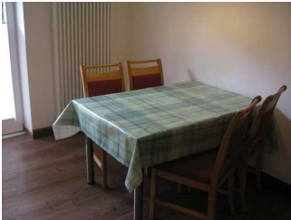
Esstisbereich in der Küche.