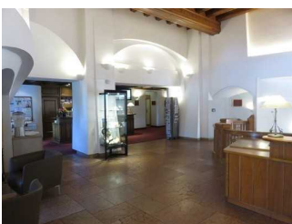
Weg zur Rezeption