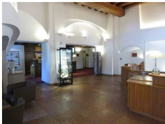
Weg zur Rezeption