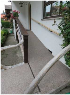
Rampe vor dem Eingang