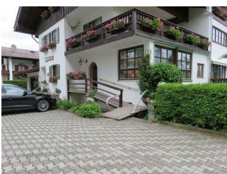
Weg zum Eingang