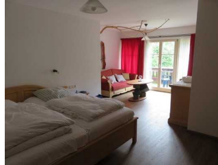
Schlafzimmer mit Zugang zum Balkon