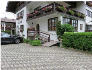
Weg zum Eingang