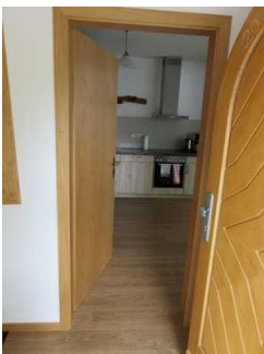
Tür nach der Diele

Die Tür ist keine Karussell- oder Rotationstür.