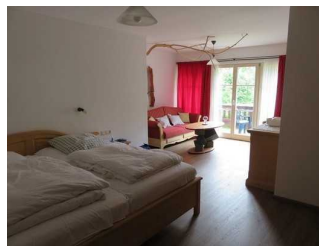
Schlafzimmer mit Zugang zum Balkon