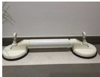
variabler Haltegriff mit Saugnäpfen