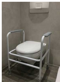
Toilette mit Aufstehhilfe