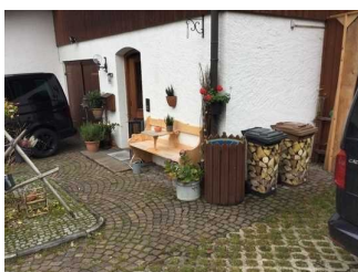
Weg zwischen Parkplatz und Eingang