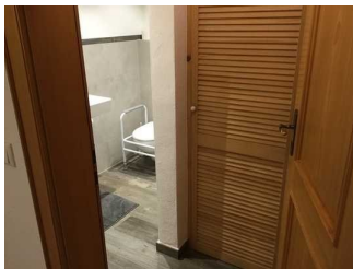
Tür zum Badezimmer