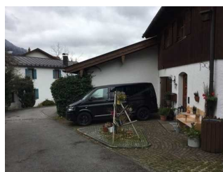
Weg zwischen Parkplatz und Eingang