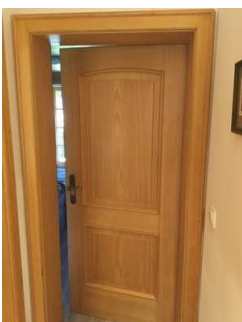
Tür zum Schlafzimmer