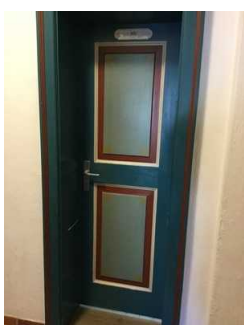
EG: Öffentliches WC