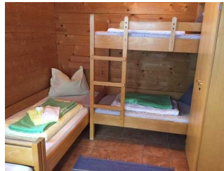
Blockhaus: Zimmer Nr. B02 - Schlafraum