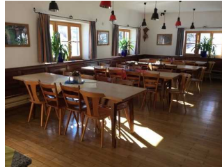
EG: Speiseraum „Leonhardistube“