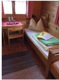
Blockhaus: Zimmer Nr. B02 - Schlafraum