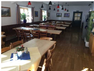
EG: Speiseraum „Leonhardistube“