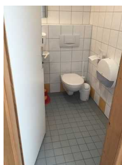
EG: Öffentliches WC