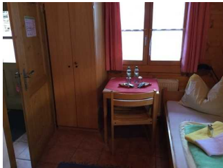
Blockhaus: Zimmer Nr. B02 - Schlafraum