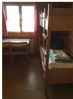
Blockhaus: Zimmer Nr. B04 - Schlafraum