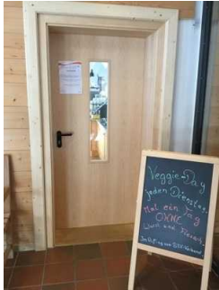
EG: Speiseraum „Leonhardistube“