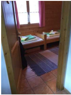
Blockhaus: Zimmer Nr. B02 - Schlafraum