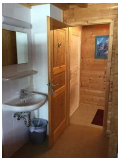
Blockhaus: Zimmer Nr. B04 - Schlafraum