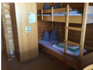
Blockhaus: Zimmer Nr. B04 - Schlafraum