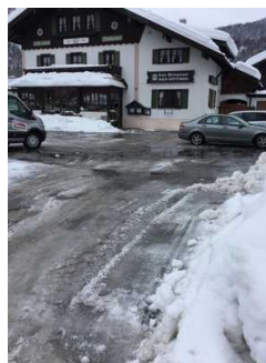
Eingangsbereich Haupteingang Restaurant - Café