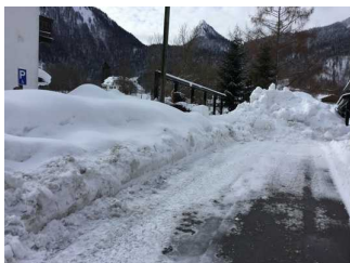
Weg zwischen Parkplatz und Eingang Gästehaus (Zimmer)