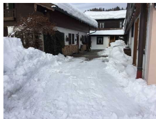
Weg zwischen Parkplatz und Eingang Gästehaus (Zimmer)