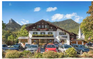
Restaurant - Café - Pension Haus Göttfried