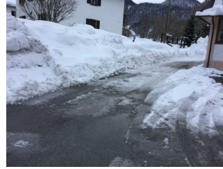
Weg zwischen Parkplatz und Haupteingang Restaurant - Café