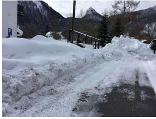
Weg zwischen Parkplatz und Eingang Gästehaus (Zimmer)