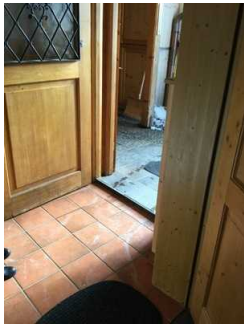
Weg zwischen Eingang Gästehaus und Zimmer