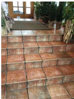
Treppe zwischen Haupteingang und Eingang Gastraum