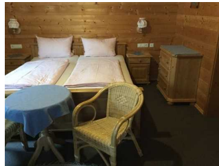
Zimmer Nr. 8 - Schlafzimmer