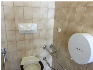
Bedienelemente öffentliches WC