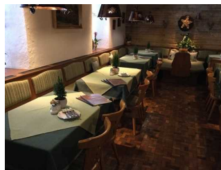
Restaurant - Café: Gastraum