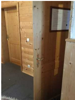
Zimmer Nr. 8 - Schlafzimmer