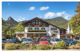
Restaurant - Café - Pension Haus Göttfried