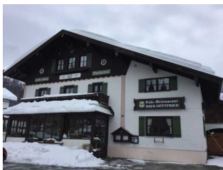
Restaurant - Café - Pension Haus Göttfried