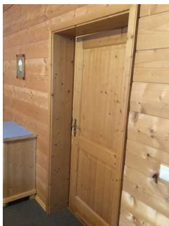
Lichtschalter + Türgriff Zimmer