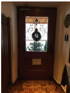
Restaurant - Café: Gastraum