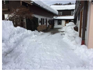
Weg zwischen Parkplatz und Eingang Gästehaus (Zimmer)