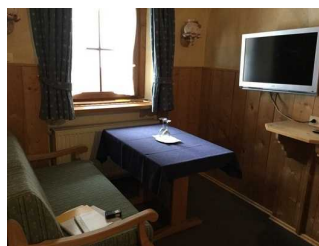
Zimmer Nr. 8 - Schlafzimmer