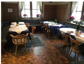
Restaurant - Café: Gastraum