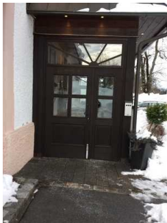
Eingangsbereich Haupteingang Restaurant - Café