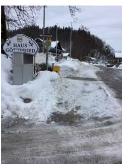
Weg zwischen Bushaltestelle und Haupteingang Restaurant - Café