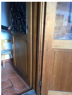
Tür 2 zum Gästehaus