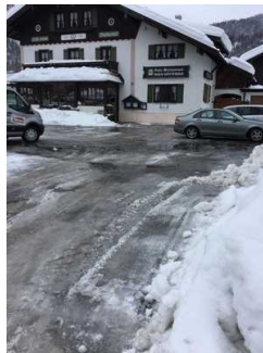
Eingangsbereich Haupteingang Restaurant - Café