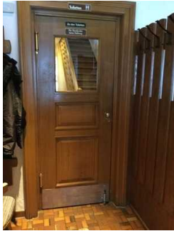
Tür zum Gastraum (vom rückwärtigen Eingang kommend)