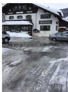
Weg zwischen Bushaltestelle und Haupteingang Restaurant - Café