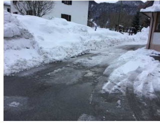
Weg zwischen Parkplatz und Haupteingang Restaurant - Café