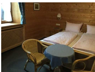
Zimmer Nr. 8 - Schlafzimmer