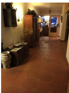
Weg zwischen Rezeption und Frühstücksraum sowie Rampe zum Flur zu den Zimmern