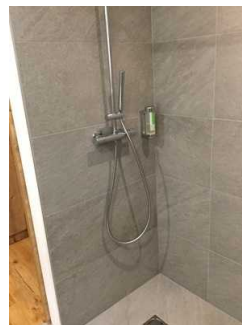
Zimmer Nr. 14 – Badezimmer