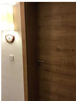
Zimmer Nr. 14 – Schlafzimmer