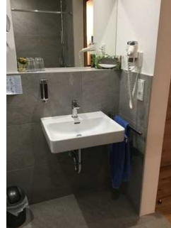
Zimmer Nr. 13 – Badezimmer