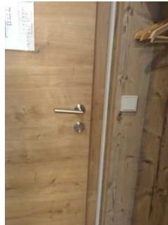
Türgriffe + Lichtschalter Zimmer