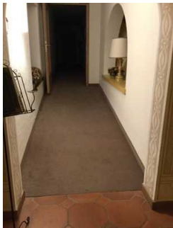
Flur zu den Zimmern