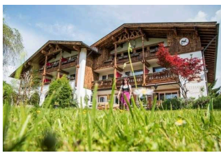
Gästehaus am Kurpark