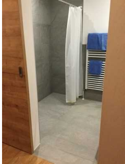
Zimmer Nr. 13 – Badezimmer