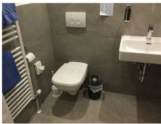
Zimmer Nr. 13 – Badezimmer