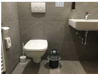
Zimmer Nr. 14 – Badezimmer