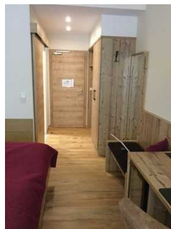
Zimmer Nr. 14 – Schlafzimmer