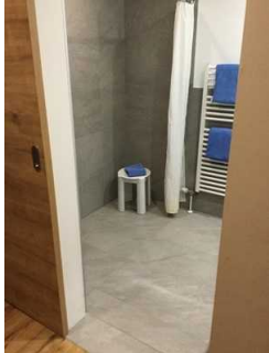
Zimmer Nr. 14 – Badezimmer