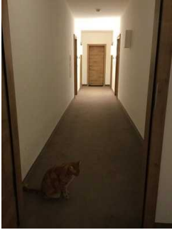
Flur zu den Zimmern