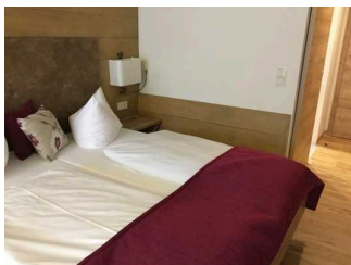
Zimmer Nr. 14 – Schlafzimmer