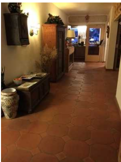
Weg zwischen Rezeption und Frühstücksraum sowie Rampe zum Flur zu den Zimmern