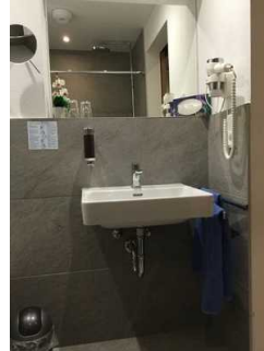
Zimmer Nr. 14 – Badezimmer