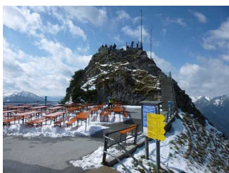
Sitzgelegenheiten auf der Terrasse.