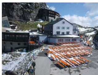
Überblick über die Aussichtsterrasse.