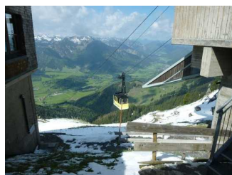
Wendelstein- Seilbahn während der Fahrt.