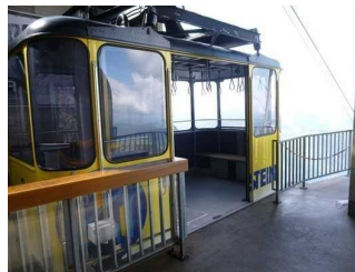
Zustieg zu der Seilbahn.

Weitere Angaben nach Auskunft des Betreibers: