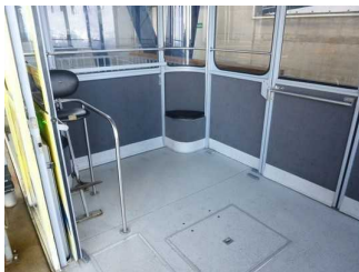
Innenraum der Kabine.