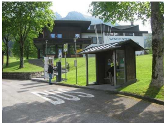
Bushaltestelle an der Wendelsteinbahn.

Entfernung der Haltestelle für Menschen mit Behinderung zum Eingangsbereich: 50 m.