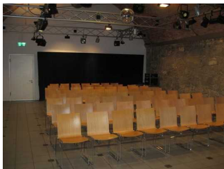
Blick auf die Ausstattung von einem Gewölberaum.