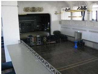
Draufsicht auf den Saal.