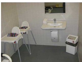
Man sieht das Waschbecken und Kinderstühle.