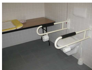
WC mit Haltegriffen und Wickeltisch sind zu sehen.