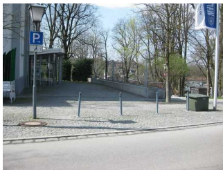
Parkplatz an der Straße vor der T-Info.