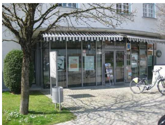
Blick auf den Eingangsbereich