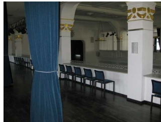
Galerie im 2. OG vorhanden.