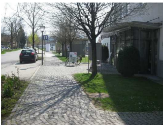
Weg vom Parkplatz zum Eingang der T- Info.