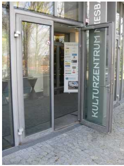
Zugang zum Kulturzentrum.