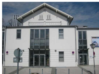
Außenansicht vom Eingang zum Kulturzentrum.