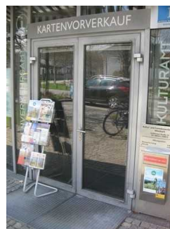
Eingangstür zur T- Info