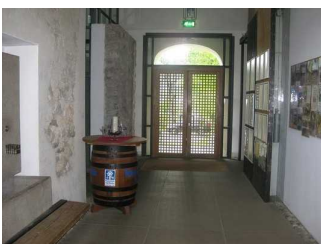
Weg vom Eingang zur Gastronomie und zu den WC's.