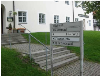
Beschilderung im Außenbereich.

Es sind Informationen vorhanden, die der Orientierung dienen und aus Wörtern bestehen.