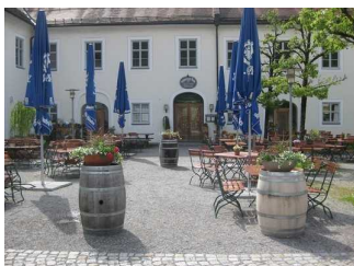
Eingangsbereich und Außengastronomie.