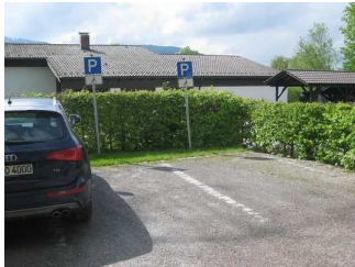
Parkplatz für Menschen mit Behinderung.