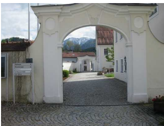
Weg vorm Eingangsbereich.