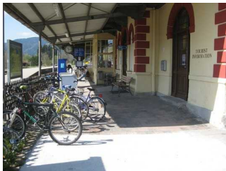
Weg vom Eingang zum Warteraum zu den Gleisen.