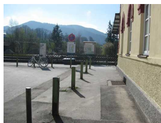
Weg vom Haupteingang zum Hintereingang.