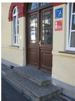
Treppe vor dem Haupteingang.