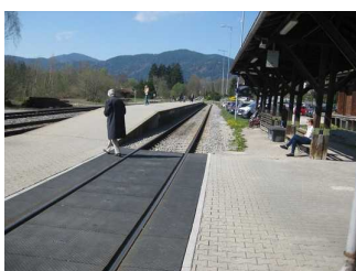
Überquerung zu den Gleisen.