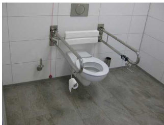
Zu sehen ist das WC und die Haltegriffe.