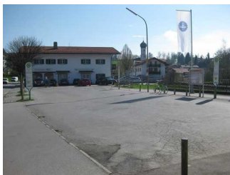
Vorplatz und Bushaltestelle in Gmund.

Entfernung der Haltestelle für Menschen mit Behinderung zum Eingangsbereich: 20 m.