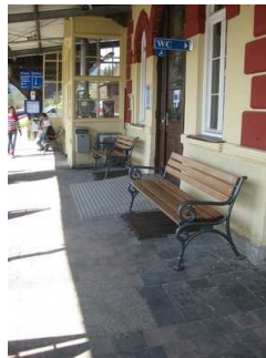
Sitzgelegenheiten im Außenbereich.