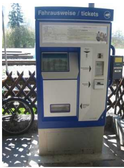
Fahrkartenautomat im Außenbereich.

Bewegungsfläche vor dem Automaten - Breite: 500 cm.