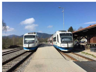
Tegernseebahn - Haltestelle in Gmund.