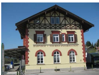
Sicht auf den Hintereingang (links).