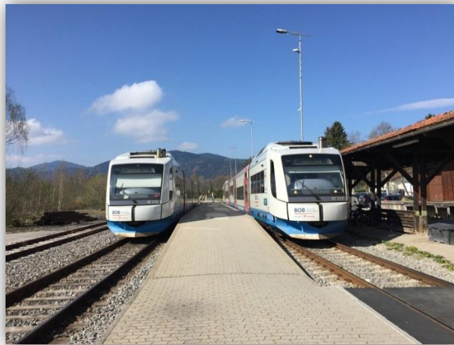
Tegernseebahn – Haltestelle Gmund