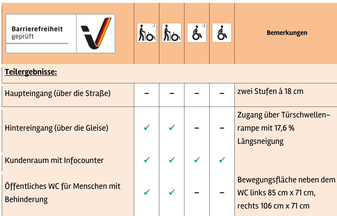
Tabelle 1: Überblick über das Prüfergebnis