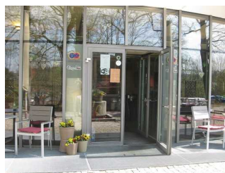
Eingangsbereich vom Culinaria.