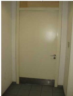
Verbindungstür Restaurant und Flur zum WC.

Die Tür ist keine Karussell- oder Rotationstür.