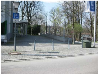
Parkplatz an der Straße vor der T-Info.