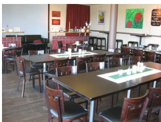
Bestuhlung im Restaurant Culinaria.