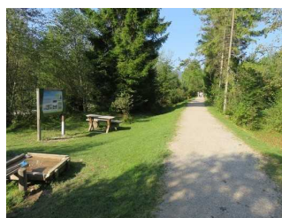
Weg und Stationen