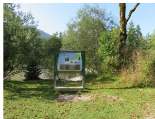
Erlebnisstation am Wegesrand