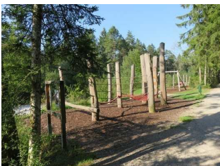
Spielgeräte / Station

Bewegungsfläche vor der Station/dem Objekt/Exponat - Breite: 200 cm.