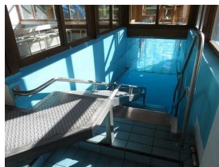
Einstieg in das Becken