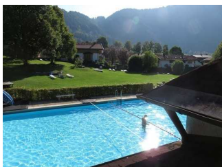
Blick auf das Becken von oben