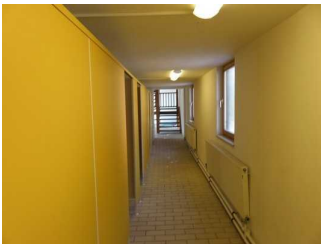
Weg an den Umkleiden