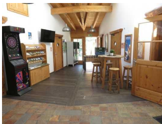
Flur / Foyer