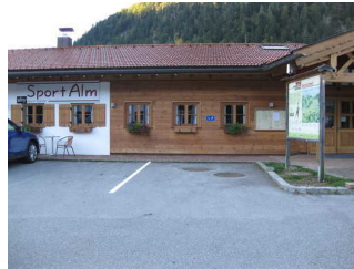
Behinderten PKW Stellplatz