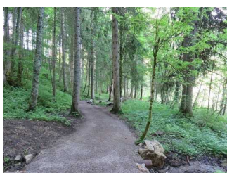
Weg am Westufer