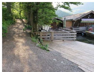
Bootsverleih und Neigungen