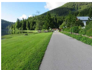
Wegeabschnitt Ostseite vom See - Asphalt