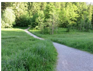
Weg durch den Wald auf der Westseite