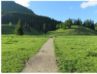
Weg auf der Westseite