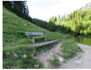
Bank am Westufer