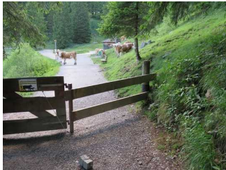
Tor für die Kühe