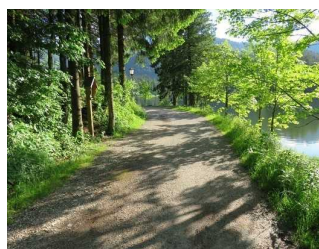
Weg nach dem Parkplatz