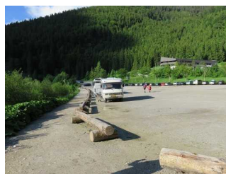
Parkplatz "am See"