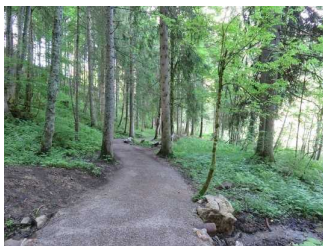
Weg am Westufer