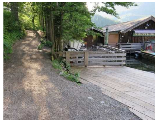
Bootsverleih und Neigungen