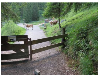
Tor für die Kühe

000 Allgemeine Angaben zum gesamten Wanderweg (nur einmal pro Weg ausfüllen) Nein