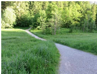
Weg durch den Wald auf der Westseite