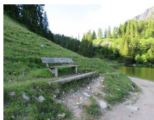
Bank am Westufer