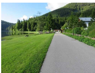
Wegeabschnitt Ostseite vom See - Asphalt