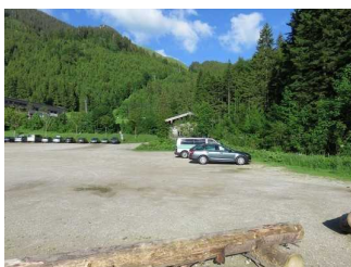
Große Parkfläche am See