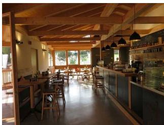
Caffee und Lunchery-Raum