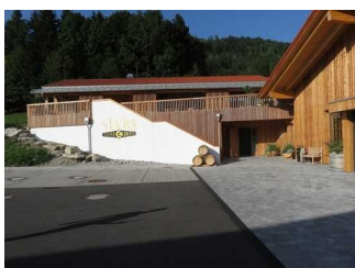
Weg zum Eingang