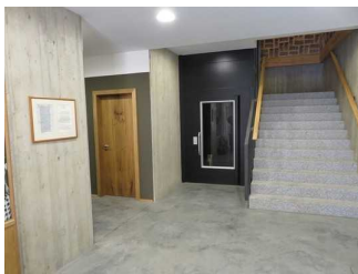
Treppe zur Caffee und Lunchery