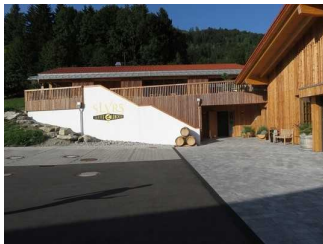
Weg zum Eingang