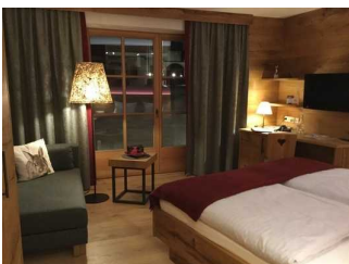
Zimmer Nr. 204 - Schlafzimmer