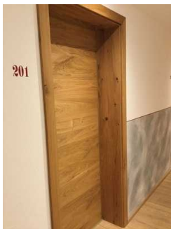
Landhaus: Zimmer Nr. 201 - Schlafzimmer