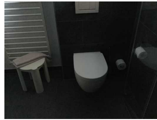
Landhaus: Zimmer Nr. 201 - Badezimmer