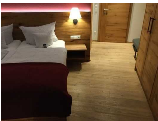
Zimmer Nr. 204 - Schlafzimmer