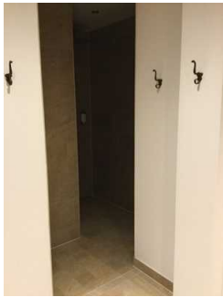
Landhaus - UG: Wellnessbereich - Duschen