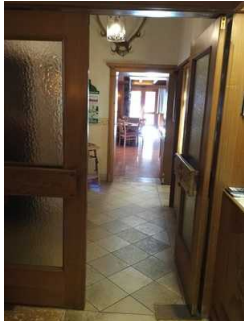
Haupthaus: Veranda rechts