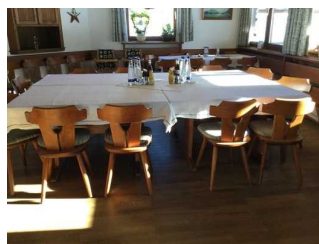
Haupthaus: Veranda links