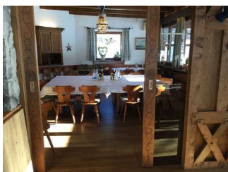
Haupthaus: Veranda links