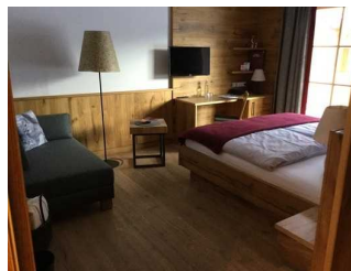
Landhaus: Zimmer Nr. 201 - Schlafzimmer