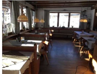
Haupthaus: Veranda rechts