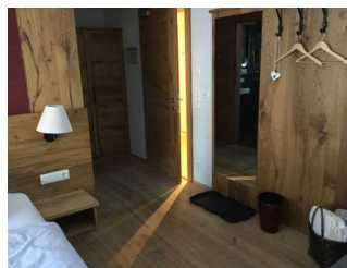
Landhaus: Zimmer Nr. 201 - Schlafzimmer