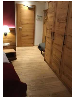
Zimmer Nr. 204 - Schlafzimmer