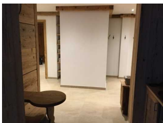
Landhaus - UG: Wellnessbereich - Saunabereich mit Ruheraum