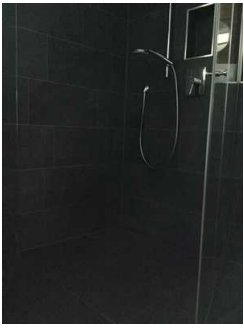
Landhaus: Zimmer Nr. 201 - Badezimmer