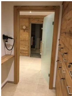
Landhaus - UG: Wellnessbereich - Saunabereich mit Ruheraum