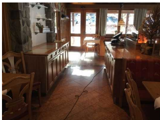
Haupthaus: Veranda rechts