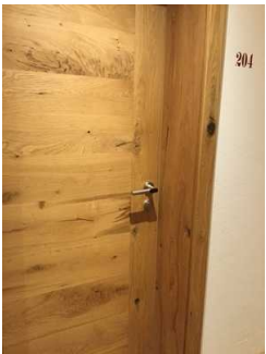
Zimmer Nr. 204 - Schlafzimmer