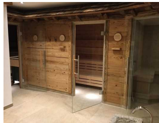
Landhaus - UG: Wellnessbereich - Saunabereich mit Ruheraum