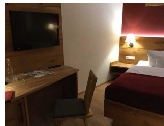
Zimmer Nr. 204 - Schlafzimmer