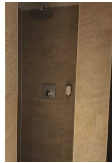
Landhaus - UG: Wellnessbereich - Duschen