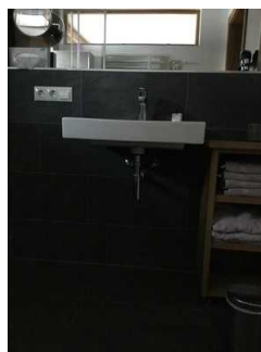
Landhaus: Zimmer Nr. 201 - Badezimmer