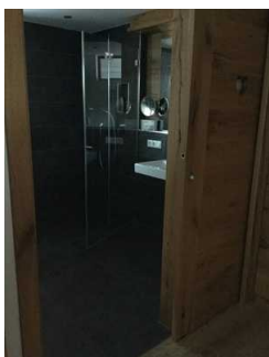
Landhaus: Zimmer Nr. 201 - Badezimmer