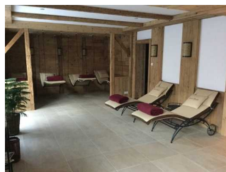
Landhaus - UG: Wellnessbereich - Saunabereich mit Ruheraum