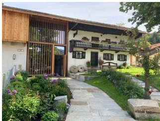
Veranstaltungsraum im Schlierseer Heimatmuseum