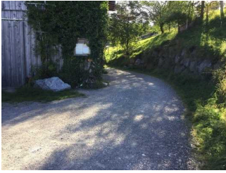
Weg zwischen Parkplatz und Eingang