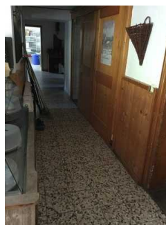
Weg zwischen Gaststube und öffentlichem WC