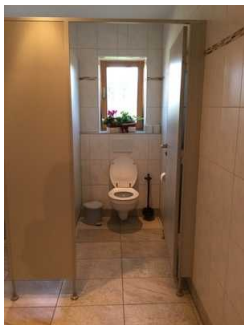
Öffentliches WC in der Damentoilette