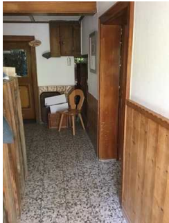
Weg zwischen Eingang und Gastraum