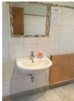
Öffentliches WC in der Damentoilette