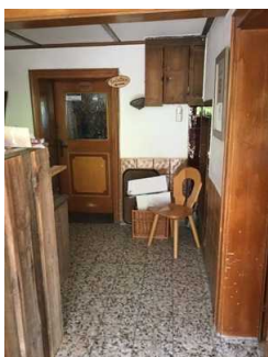
Weg zwischen Gaststube und öffentlichem WC