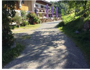
Weg zwischen Parkplatz und Eingang