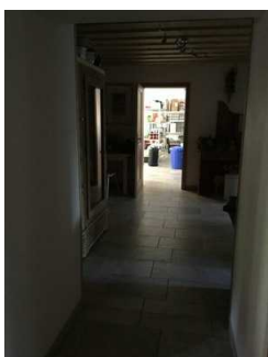
Weg zwischen Gaststube und öffentlichem WC