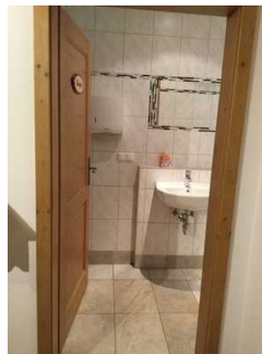
Türgriff + Bedienelemente WC