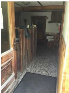
Türgriff und Gehbahn