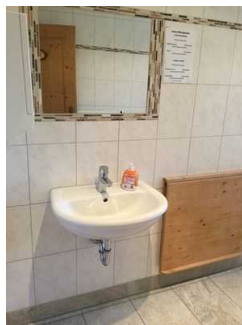
Öffentliches WC in der Damentoilette